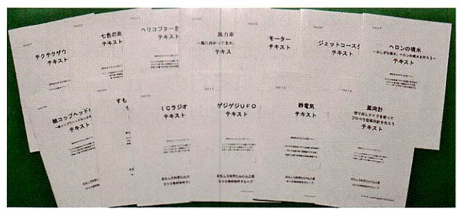
テキスト 全13テーマ