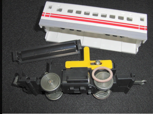
写真2 動輪のゴム輪をとりはずす

ては摩擦が大きくなりすぎて回転が止まってしまうからである。適度にスリップするようにするのがポイントである。