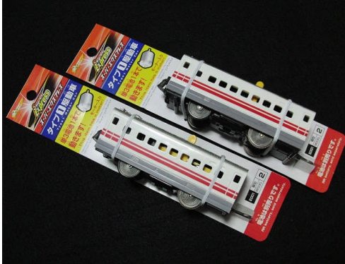
写真1 タイプ1・駆動車