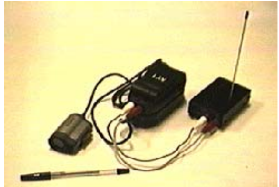
図1 カメラ(左)とトランスミッター(右)

バッテリーで動作可能です。映像信号はこのカメラで撮影し、即、電波にのせて送信し、室内に置いたアンテナEで受信してFのVTRデッキで記録すると共に、モニターに出力してリアルタイムで観察します。映像信号をUHFの電波に変換するのがトランスミッターCです。たまたま手元にあった安物で、これもバッテリー（006P）で動作します。重量はカメラ、バッテリー、トランスミッターで計625gと軽量です。（図1）